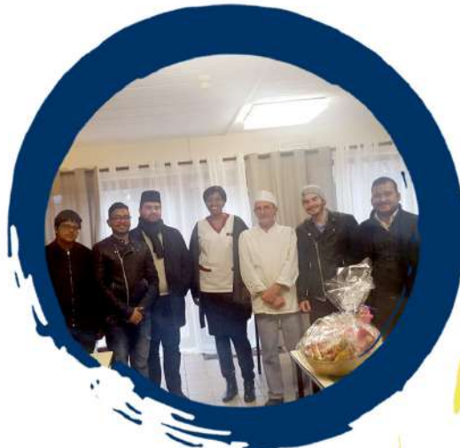
Visite Maison de Repos à Liège