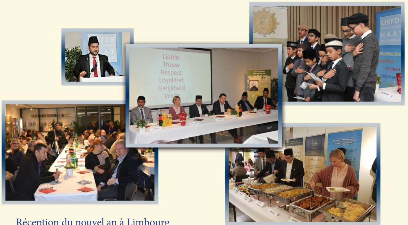
Réception du nouvel an à Limbourg