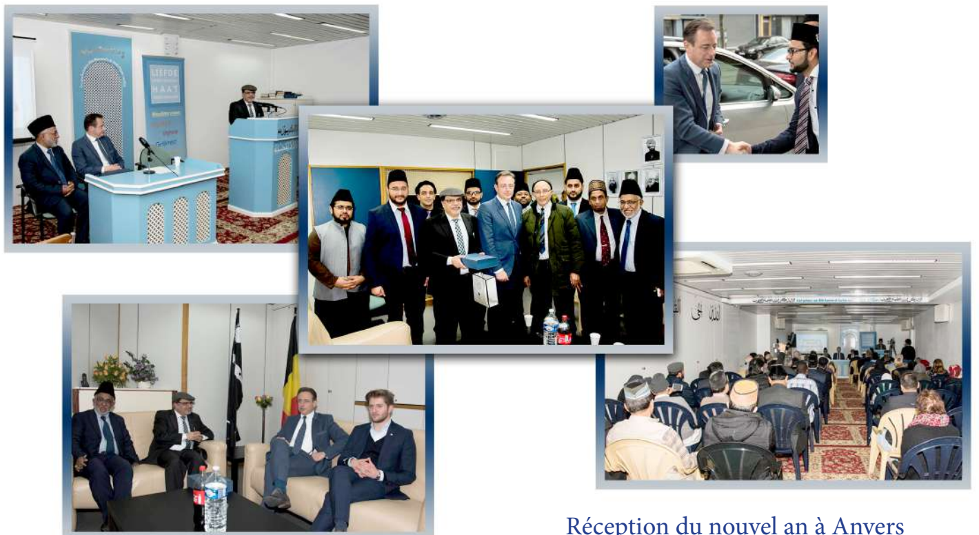
Réception du nouvel an à Anvers