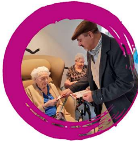
Visite Maison de repos à Saint-Trond