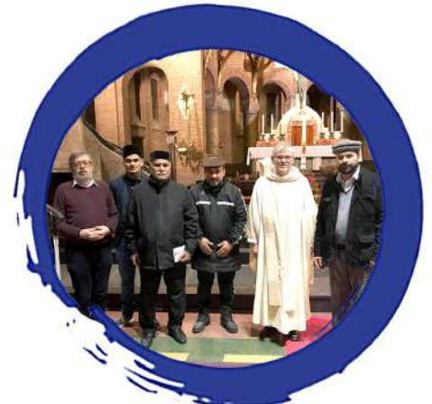
Visite d'Eglise à Turnhout