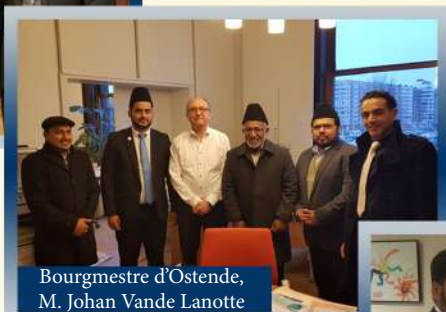
Bourgmestre d'Ostende, M. Johan Vande Lanotte