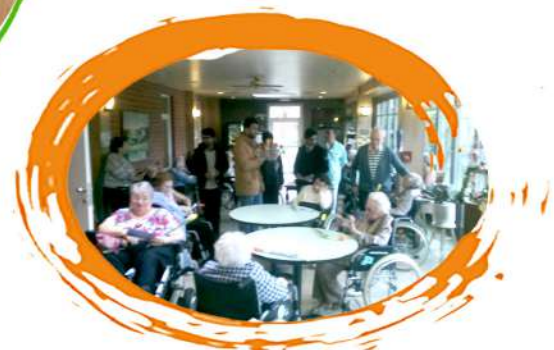
Visite Maison de repos à Bruxelles