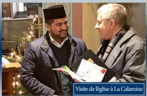
Visite de l'église à La Calamine

Comme chaque année, cette fois-ci la Communauté Ahmadiyya en Belgique a organisé plusieurs visites dans les églises et les maisons de repos durant la période des fêtes de fin d'année dans les différentes villes du pays. Le but de ces visites était de présenter la Communauté Ahmadiyya et de distribuer des fleurs et des cartes de nouvelle année aux gens pour leur souhaiter meilleurs vœux.