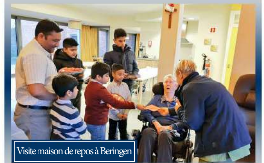
Visite maison de repos à Beringen

D'après ce programme, nous avons eu l'occasion de visiter les villes suivantes : La Calamine, Liège, Dilbeek, Uccle, Eupen, Sint-Truiden, Hasselt and Ostende.