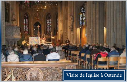
Visite de l'église à Ostende