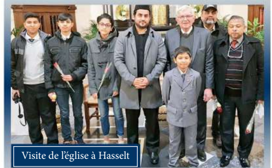
Visite de l'église à Hasselt

Comme chaque année, cette fois-ci la Communauté Ahmadiyya en Belgique a organisé plusieurs visites dans les églises et les maisons de repos durant la période des fêtes de fin d'année dans les différentes villes du pays. Le but de ces visites était de présenter la Communauté Ahmadiyya et de distribuer des fleurs et des cartes de nouvelle année aux gens pour leur souhaiter meilleurs vœux.