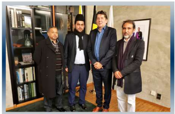
Rencontre avec le gouverneur de la province du Limbourg