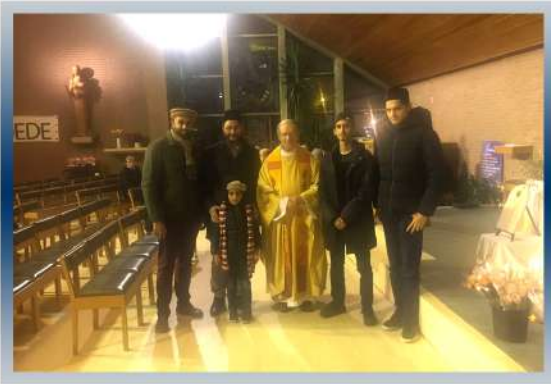
Distribution de Fleurs dans une église à Dilbeek