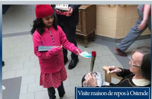
Visite maison de repos à Ostende

Visites des maisons de repos à Beringen, Merksem, Hasselt, Anvers and Ostende. Cette année, nous avons aussi eu l'opportunité de visiter la section pédiatrique de l'hôpital La Citadelle à Liège pour distribuer des cadeaux aux enfants.