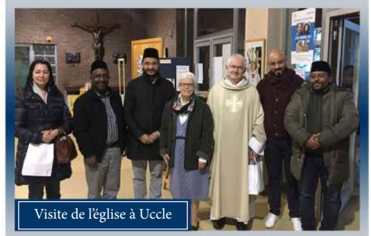
Visite de l'église à Uccle