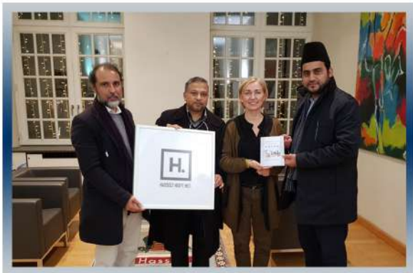
Rencontre avec le bourgmestre d'Hasselt