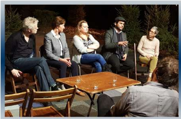
Programme à Turnhout