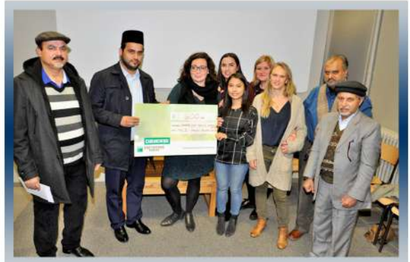
La communauté à Saint-Trond ont donné un chèque de €600 à l'organisation « OKAN JONGEREN »