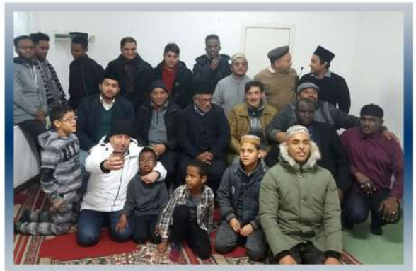
Réunion à Liège