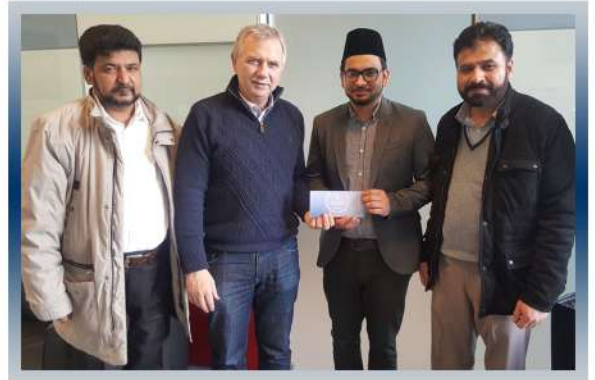
Réunion avec le Maire de Tornhout