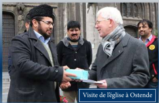
Visite de l'église à Ostende

D'après ce programme, nous avons eu l'occasion de visiter les villes suivantes : La Calamine, Liège, Dilbeek, Uccle, Eupen, Sint-Truiden, Hasselt and Ostende.