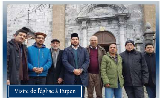
Visite de l'église à Eupen

Visites des maisons de repos à Beringen, Merksem, Hasselt, Anvers and Ostende. Cette année, nous avons aussi eu l'opportunité de visiter la section pédiatrique de l'hôpital La Citadelle à Liège pour distribuer des cadeaux aux enfants.