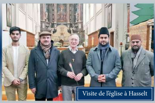
Visite de l'église à Hasselt