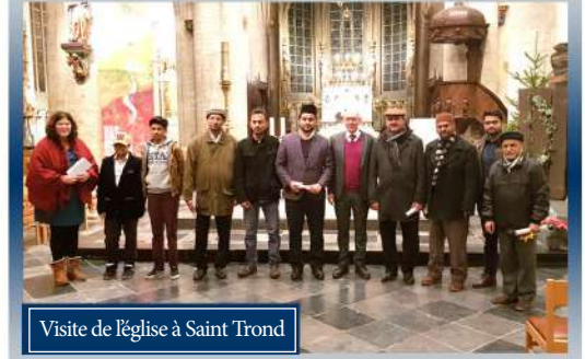
Visite de l'église à Saint Trond