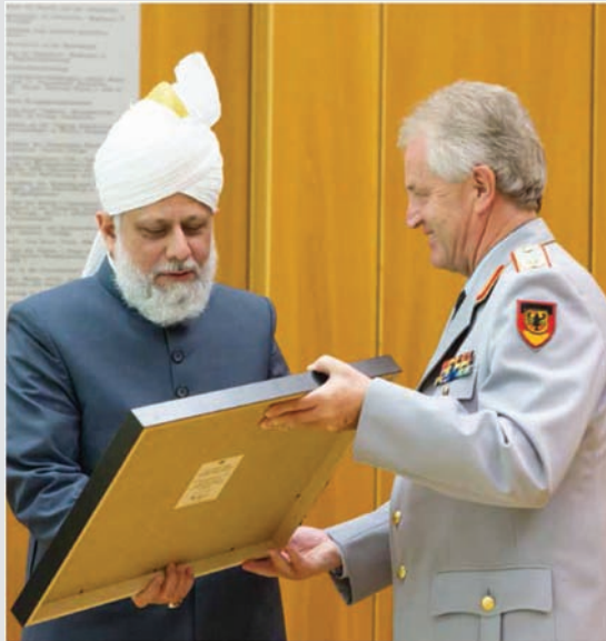
Gjeneral Brigade Bach duke i dhuruar një pikturë Kalifit V të Mesihut të Premtuar