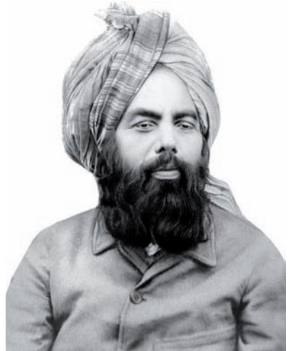
Hazret Mirza Ghulam Ahmed a.s. Mesih i Premtuar dhe Imam Mehdi

Muslimanët ahmedianë dallohen nga grupe të tjera muslimane gjithashtu për shkak se Xhemati i tyre është i vetmi xhemat në Islam që gëzon sistemin e Kalifatit, sistemi ky që u vendos pas vdekjes së Ghulam Ahmedit a.s.. Deri më tani pesë Kalifët e tij, njëri pas tjetrit e udhëhoqën Xhematin dhe u angazhuan tërësisht në përbushjen e misionit të përhapjes së Islamit. Sot, nën udhëheqjen e Kalifit të pestë Hazret Mirza Masroor Ahmed, ky Xhemat gjendet në më shumë se 200 vende të botës, ka botuar Kuranin në më shumë se 70 gjuhë të botës, ka ndërtuar mijëra xhami, qindra spitale dhe shkolla anë mbanë botës. Tashmë Xhemati transmeton mesazhin e tij në gjuhë të