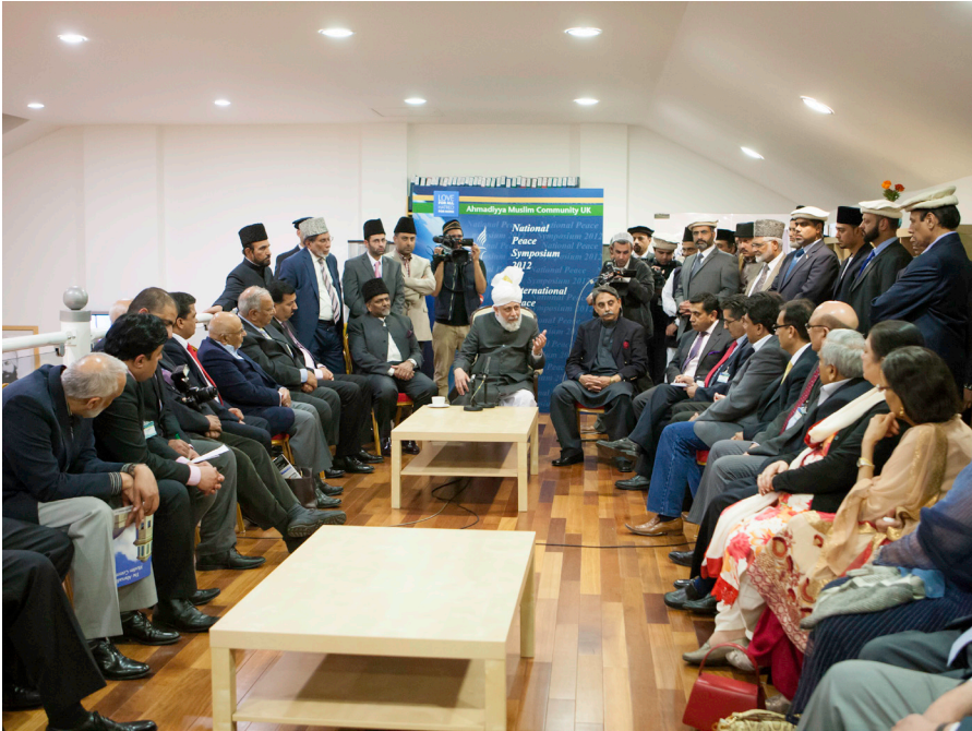
Hadhrat Mirza Masroor Ahmad Khalifatul-Masih V aba talar till Pakistansk media angående världsfrågor