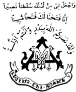
MIRZA MASROOR AHMAD HEAD OF THE AHMADIYYA COMMUNITY IN ISLAM

بِسْمِ اللّٰهِ الرَّحْمٰنِ الرَّحِیْمِ نُحْمَدُهُ وَنُصَلِّیْ عَلٰی رَسُوْلِهِ الْکَرِیْمِ وَعَلٰی عِبْدِهِ الْمَسِیْحِ الْمَوْعُوْدِ خدا کے فضل اور رحم کے ساتھ هوالتااصر