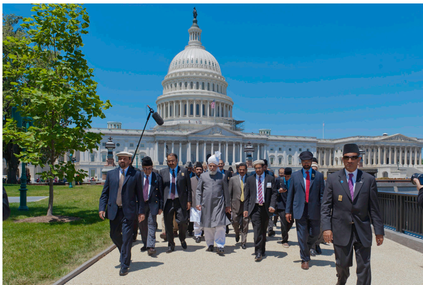
Hadhrat Mirza Masroor Ahmad Khalifatul-Masih V aba vid U.S. Capitol Hill efter sitt historiska tal till amerikanska statsmän och byråkrater