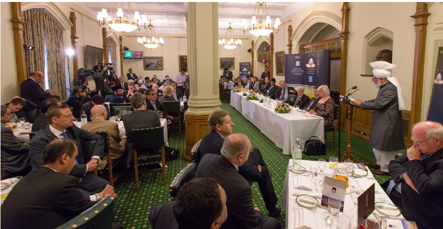
Hadhrat Khalifatul-Masih V aba framför sitt historiska tal till parlamentariker, dignitärer och diplomater vid House of Commons, London 11 juni 2013