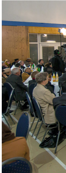
Hadhrat Mirza Masroor Ahmad, Khalifatul-Masih V aba framför sitt tal vid Baitur-Rashid moskén