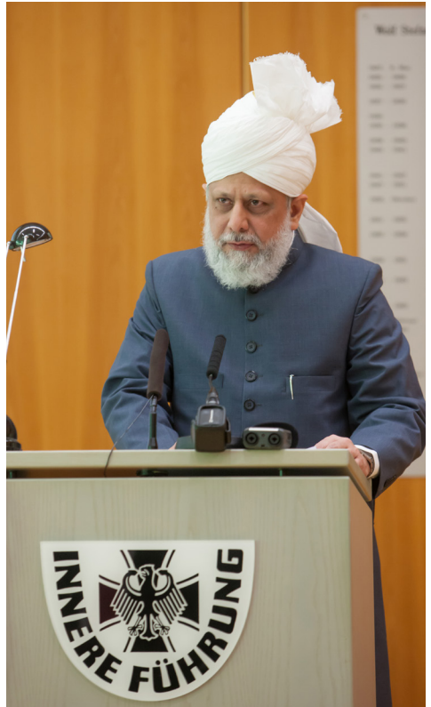
Hadhrat Mirza Masroor Ahmad Khalifatul-Masih V aba talandes till den Federala Tyska Armén