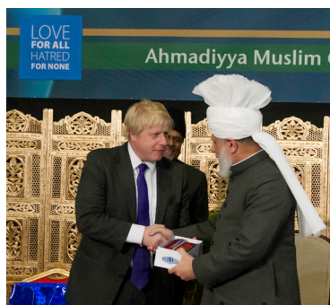
Borgmästaren av London Boris Johnson framför en souvenir föreställande en Londonbus till Hans Helighet