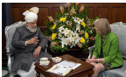
Inrikesminister Theresa May med Hadhrat Khalifatul-Masih V aba