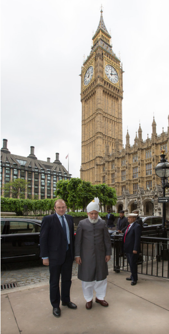
Hadhrat Khalifatul-Masih V aba tas emot i House of Commons av parlamentarikern Ed Davey, London 11 juni 2013