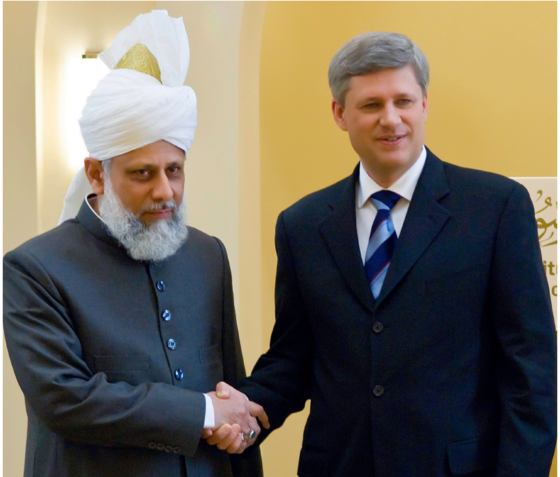
Premiärministern av Kanada med Hadhrat Mirza Masroor Ahmad Khalifatul-Masih V aba