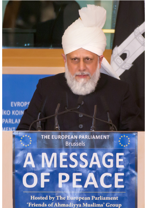
Hadhrat Mirza Masroor Ahmad, Khalifatul-Masih V aba framför sitt tal vid eventet i Europaparlamentet.