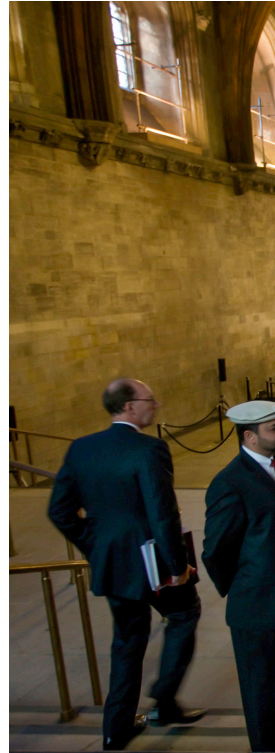
Hans Helighet framför sitt föredrag i The House of Commons