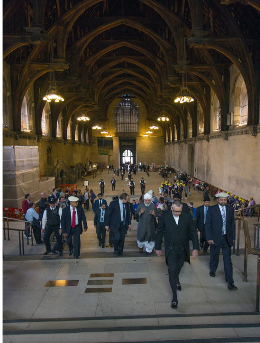
Parlamentarikern Ed Davey ledsagar Hadhrat Khalifatul-Masih V aba genom Westminster Hall i House of Commons, London 11 juni 2013