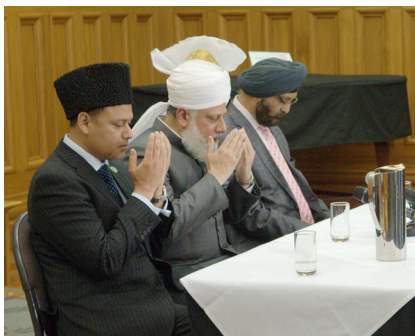
Hadhrat Khalifatul-Masih V aba leder en tyst bön vid avslutningen av det officiella eventet i Grand Hall, Nya Zeelands parlament