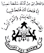
MIRZA MASROOR AHMAD HEAD OF THE AHMADIYYA COMMUNITY IN ISLAM

بِسْمِ اللّٰهِ الرَّحْمٰنِ الرَّحِیْمِ نَحْمَدُهٗ وَنُصَلِّیْ عَلٰی رَسُوْلِهِ الْکَرِیْمِ وَعَلٰی عِبْدِهِ الْمَسِیْحِ الْمَوْعُوْدِ خدا کے فضل اور رحم کے ساتھ هوالتناصر