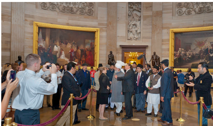
Hadhrat Mirza Masroor Ahmad Khalifatul-Masih V aba under sin officiella rundvandring i U.S. Capitol Hill