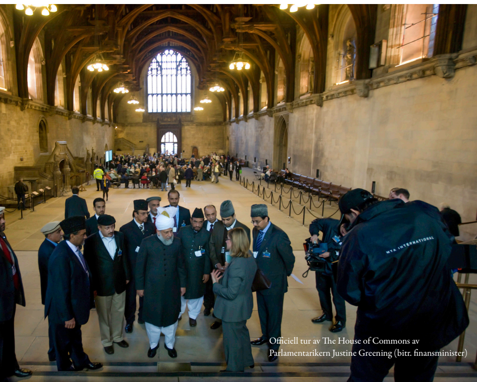
Officiell tur av The House of Commons av Parlamentarikern Justine Greening (bitr. finansminister)