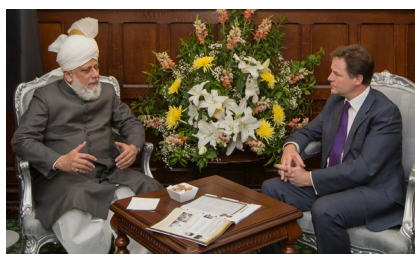
Bitr. Premiärminister Nick Clegg i samtal med Hadhrat Khalifatul-Masih aba i House of Commons, London, den 11 juni 2013