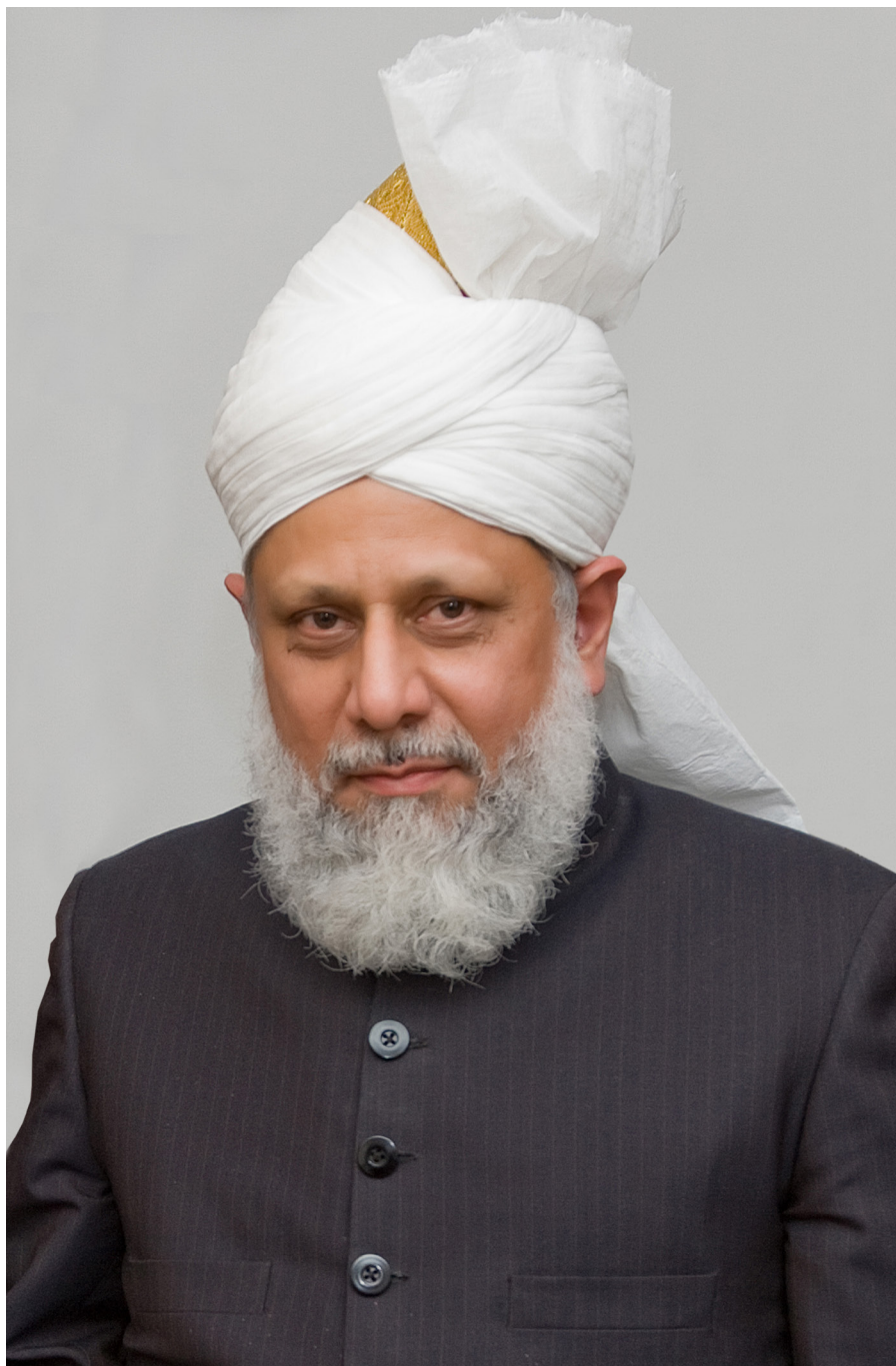
Hadhrat Mirza Masroor Ahmad Khalifatul-Masih V aba