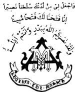
MIRZA MASROOR AHMAD HEAD OF THE AHMADIYYA COMMUNITY IN ISLAM

بِسْمِ اللّٰهِ الرَّحْمٰنِ الرَّحِیْمِ نَحْمَدُهٗ وَنُصَلِّیْ عَلٰی رَسُوْلِهِ الْکَرِیْمِ وَعَلٰی عِبْدِهِ الْمَسِیْحِ الْمَوْعُوْدِ خدا کے فضل اور رحم کے ساتھ هوالتااصر