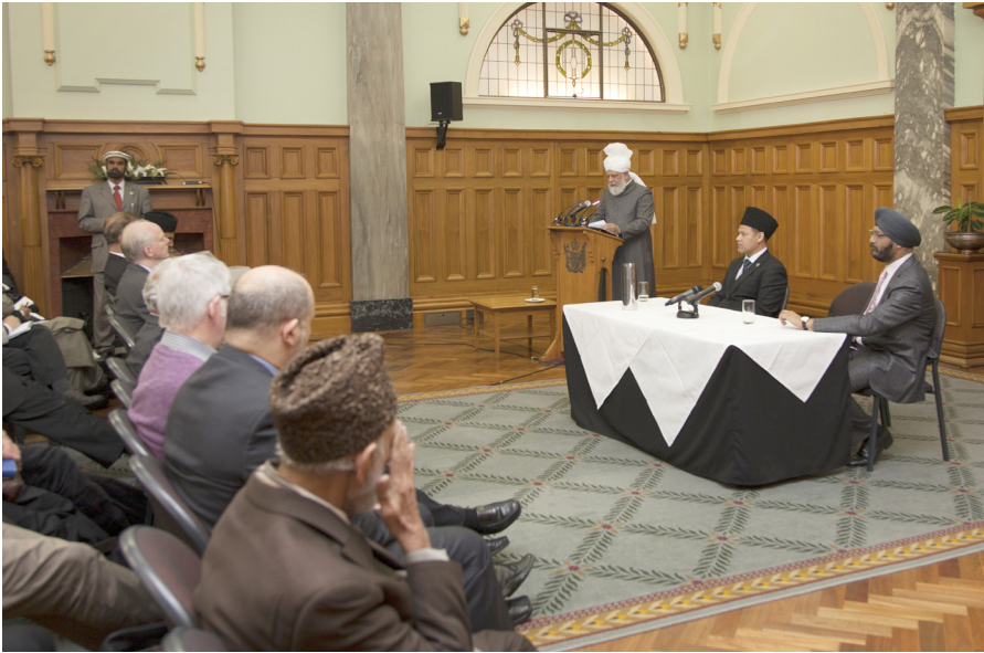
Hadhrat Khalifatul-Masih V abs framför sitt tal i Grand Hall, Nya Zeelands parlament