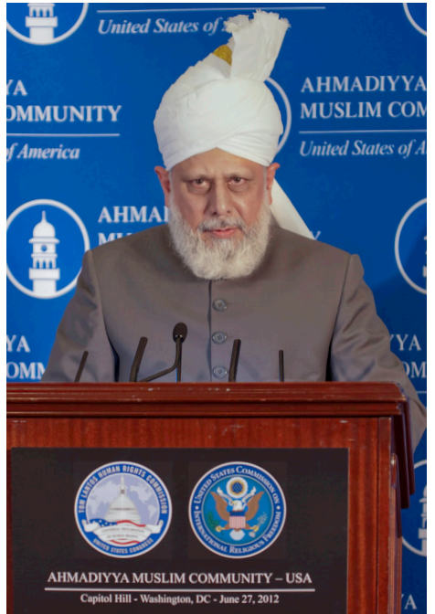
Hadhrat Mirza Masroor Ahmad Khalifatul- Masih V aba framför sitt tal i U.S. Capitol Hill