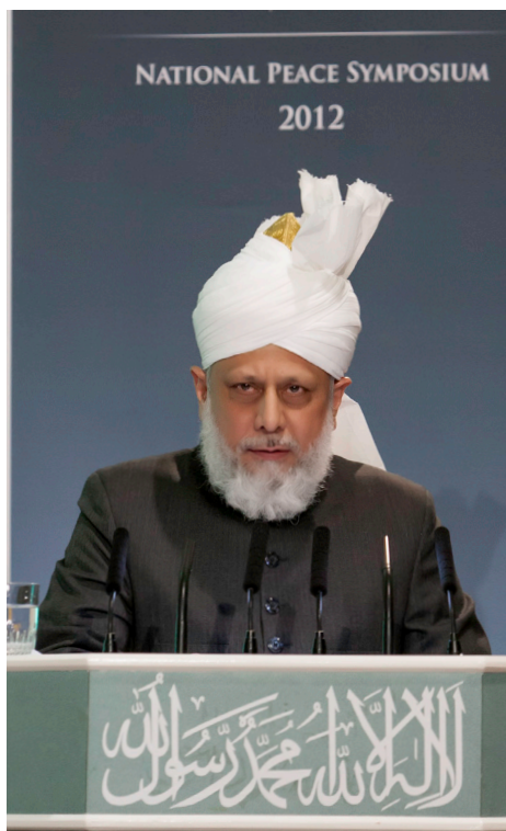
Hadhrat Mirza Masroor Ahmad Khalifatul-Masih V aba talandes vid det 9:e Annual Peace Symposium