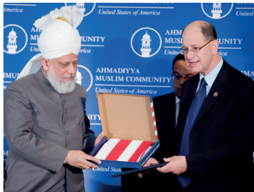
Brad Sherman (Demokratisk medlem i det amerikanske Representantshuset) framför en amerikansk flagga till Hadhrat Mirza Masroor Ahmad Khalifatul-Masih V aba