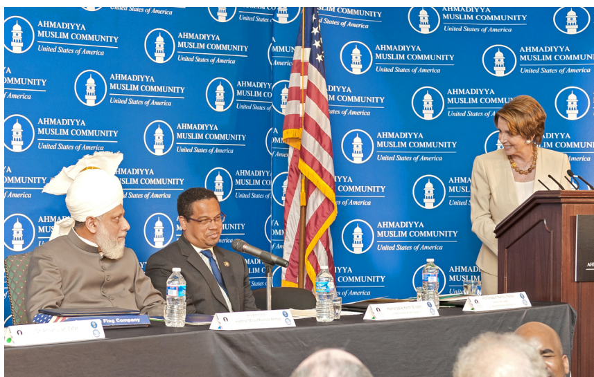
Den Amerikanska demokratiska ledaren Nancy Pelosi (D-CA) välkomnar Hans Helighet till Capitol Hill