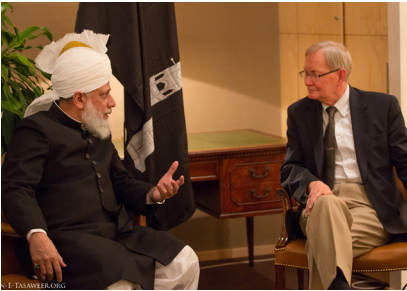
Tunne Kelam (Europaparlamentariker Lettland & vice-ordförande för "European Parliament Friends of Ahmadiyya Muslims Group") träffar Hans Helighet.