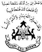
MIRZA MASROOR AHMAD HEAD OF THE AHMADIYYA COMMUNITY IN ISLAM

بِسْمِ اللَّهِ الرَّحْمَنِ الرَّحِيمِ نُحْمَدُهُ وَنُصَلِّي عَلَى رَسُوْلِهِ الْكَرِيمِ وَعَلَى عِبْدِهِ الْمَسِيْحِ الْمَوْعُوْدِ خدا کے فضل اور رحم کے ساتھ هوالتااصر