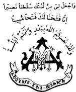
MIRZA MASROOR AHMAD HEAD OF THE AHMADIYYA COMMUNITY IN ISLAM

بِسْمِ اللَّهِ الرَّحْمَنِ الرَّحِيمِ نُحْمَدُهُ وَنُصَلِّي عَلَى رَسُولِهِ الْكَرِيمِ وَعَلَى عِبْدِهِ الْمَسِيحِ الْمَوْعُودِ خدا کے فضل اور رحم کے ساتھ هوالتااصر