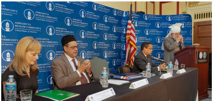
Hadhrat Mirza Masroor Ahmad Khalifatul-Masih V aba leder en tyst bön i U.S. Capitol Hill