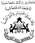
MIRZA MASROOR AHMAD HEAD OF THE AHMADIYYA COMMUNITY IN ISLAM

بِسْمِ اللّٰهِ الرَّحْمٰنِ الرَّحِیْمِ نَحْمَدُهٗ وَنُصَلِّیْ عَلٰی رَسُوْلِهِ الْکَرِیْمِ وَعَلٰی عِبْدِهِ الْمَسِیْحِ الْمَوْعُوْدِ خدا کے فضل اور رحم کے ساتھ هوالتناصر