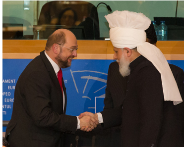
Hadhrat Khalifatul-Masih aba välkomnas av Martin Schulz, presidenten av Europaparlamentet.